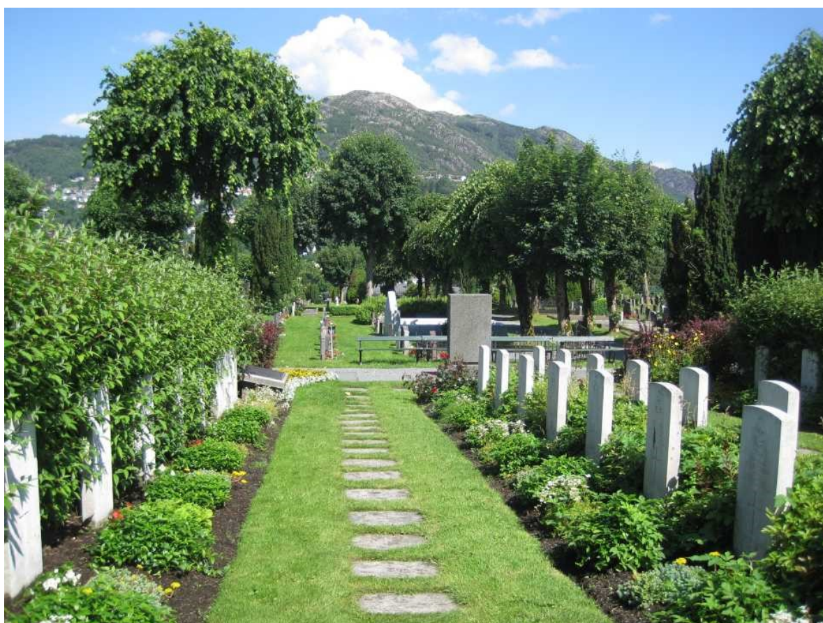
Britiske krigsgraver Møllendal