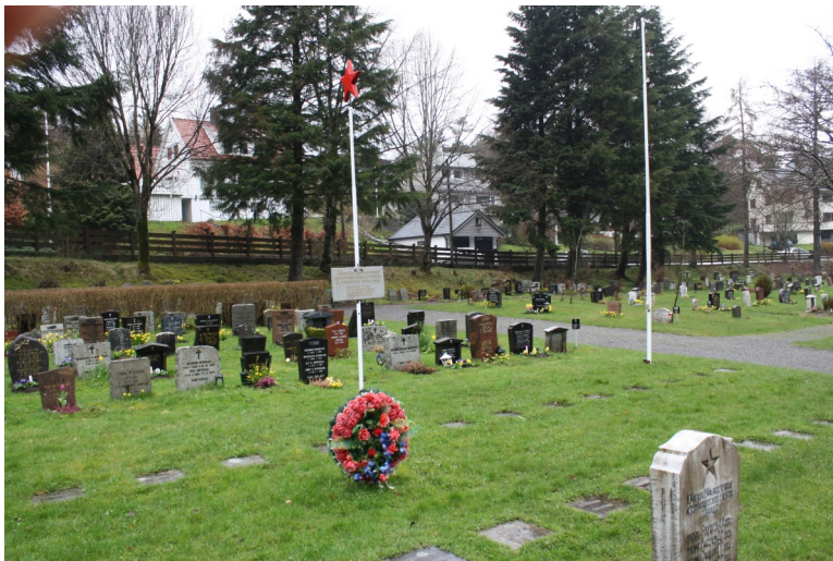
Sovjetiske krigsgraver Gravidalspollen

Det er de lokale gravplassmyndighetene som har ansvar for stell og vedlikehold av krigsgravene, mens den norske stat skal bære kostnadene. Tilskudd gis som øremerkete, årlige tilskudd. Større arbeid på steiner eller anlegg må det eventuelt søkes departementet om ekstra midler til.